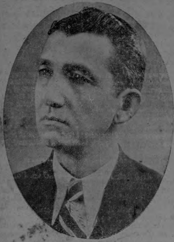
LICENCIADO DON LEON CORTES CASTRO Electo Presidente de la República para el período constitucional 1936-40

Hermosas frases del Lic. don León Cortés Futuro Presidente de la República